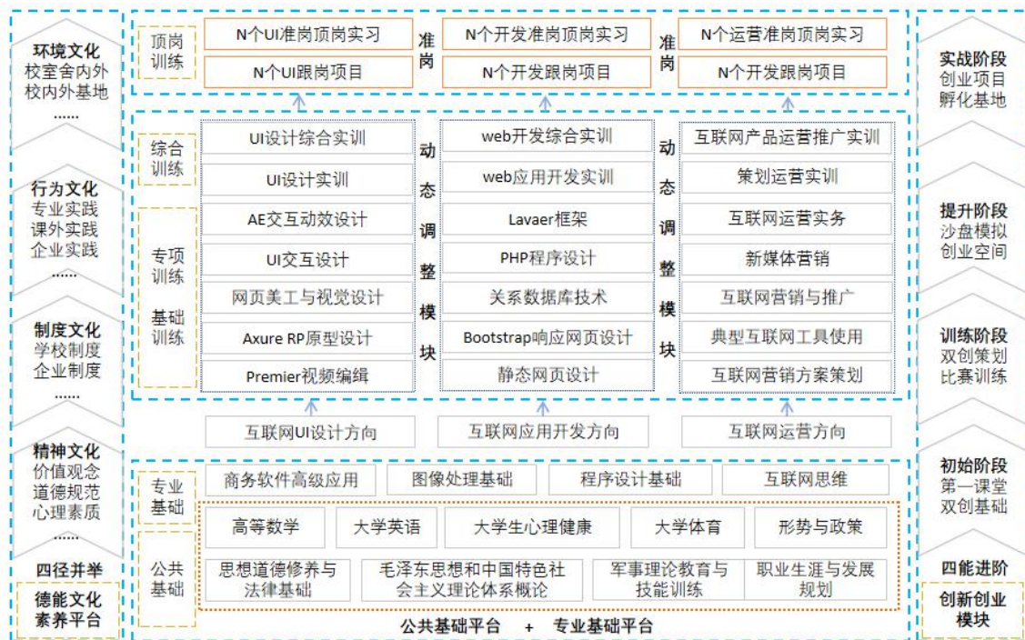
“宽平台、活模块、准岗位”课程体系图

教学中实施“班改企”，实施“项目化”课改和“准企业式”实践教学，并以社会主义核心价值观为引领，“四径并举”融校企文化，“四能进阶”协同开展双创与技能大赛育人，突出综合素质和职业能力培养，实现学生全面发展。