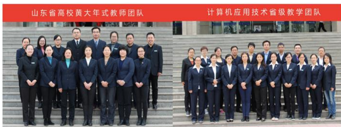
育人团队建设成果示例

五年来校企聚心聚力聚智，共建共通共享，双向推动“德职”育人模式实施，互联网学院实践成果丰硕。建成省高校黄大年式教师团队、计算机应用技术教学团队、青创人才引育建设团队，培养了省教学名师、省技能名师等10人。建成教育部协同创新中心、省技艺技能传承平台等省级以上平台基地。建设省精品资源共享课11门，校企开发“企业级项目化”45本，国家规划教材3本，专著2部。在各级各类教师教学能力比赛中获奖83项。