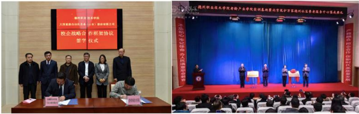
老龄产业学院等六个产业学院成立