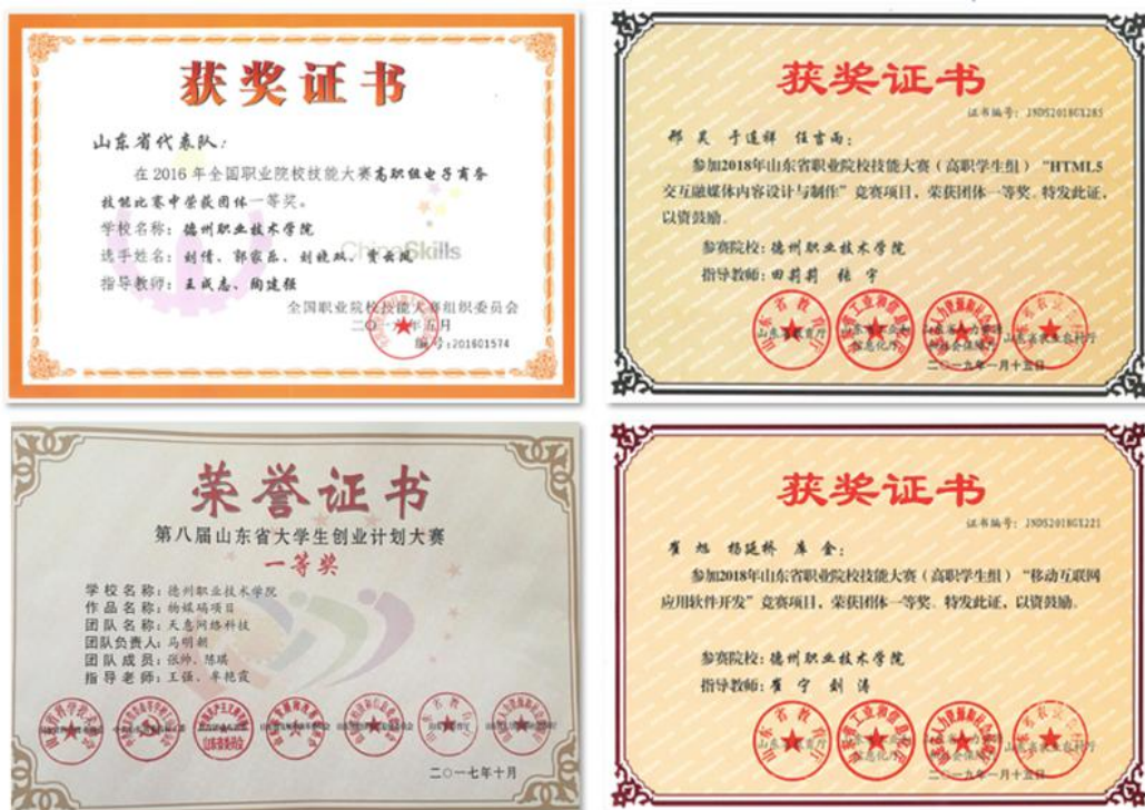
学生获得的职业院校技能大赛部分获奖证书